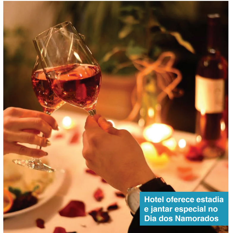
Hotel oferece estadia e jantar especial no Dia dos Namorados

Palácio Motel Endereço: Anel Viário St. Oes-